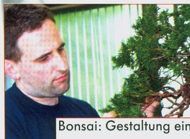
Bonsai: Gestaltung eines Sadebaums ab Seite 98