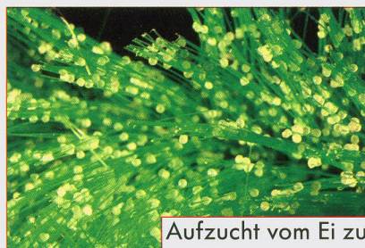
Aufzucht vom Ei zum Jungfisch ab Seite 48