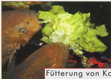
Fütterung von Koi ab Seite 90