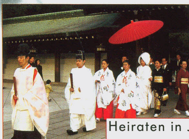
Heiraten in Japan ab Seite 122